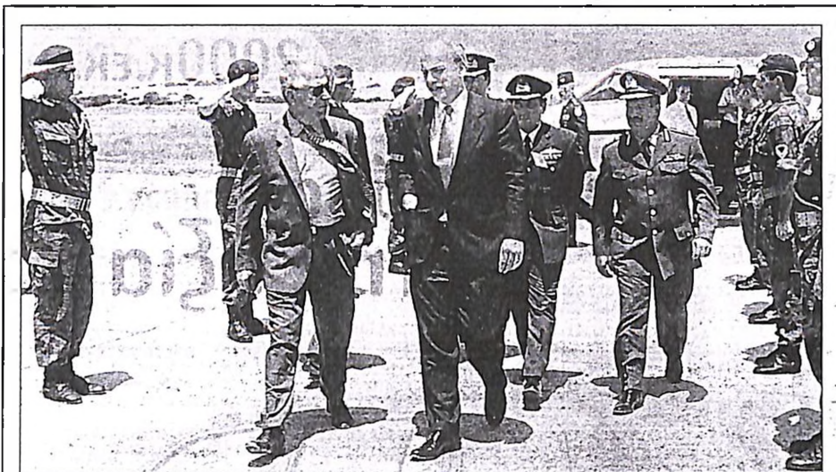
Κάποτε δεν ήθελαν να την περιλάβουν στον σχεδιασμό των νατοϊκών ασκήσεων. Ούτε καν έδιναν δραχμή για την κατασκευή του αεροδρομίου της, παρά ότι έγινε σύμφωνα με τις προδιαγραφές και τις ανάγκες εκείνης της εποχής του ΝΑΤΟ. Σήμερα η Λήμνος υποδέχεται με τον πιο επίσημο τρόπο τους Αμερικανούς. Αγλημα Αεροπορίας, τιμές επίσημου προσκεκλημένου για τον υφυπουργό Άμυνας των ΗΠΑ κ. Φρ. Κρέιμερ. Ο ομόλογός του κ. Δ. Αποστολάκης του είπε κάποια στιγμή, όταν είδε τον Αμερικανό να επιμένει για την τρομοκρατία, πως εν πάση περιπτώσει στη χώρα μας η τρομοκρατία δεν είναι λιγότερη ούτε περισσότερο από τις υπόλοιπες ευρωπαϊκές χώρες, χωρίς καν ο Έλληνας υφυπουργός να αναφέρει τη Βρετανία ή την Ιταλία.

ΣΥΜΦΩΝΑ με τον κανονισμό του Υπουργικού Συμβουλίου, τον πρωθυπουργό κ. Κ. Σημίτη που απουσιάζει αυτές τις ημέρες στη Λατινική Αμερική τον αντικαθιστά (ελλείψει αντιπροέδρου) η πρώτη τάξη υπουργών, που είναι η κυρία Βάσω Παπανδρέου. Προτού αναχωρήσει για τη Λατινική Αμερική ο κ. Σημίτης έδωσε εντολή στην υπουργό Δημόσιας Διοίκησης να πραγματοποιήσει μια σειρά συσκέψεων ανά περιφέρεια που αναμένεται να ολοκληρωθούν λίγο πριν από τη σύνοδο της Κεντρικής Επιτροπής. Στόχος, η καταγραφή των προτεραιοτήτων για το κόμμα και την κυβέρνηση ώστε να διαπιστωθούν τα προβλήματα της καθημερινότητας.