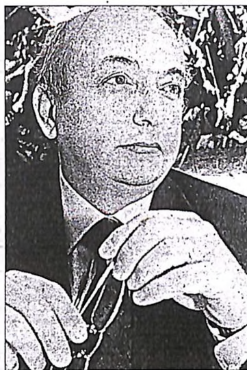
Ο κ. Τσουκάτος (δίπλα) έθεσε το κριτήριο εμπύημα: «Τι θα κάνουμε αν χάσουμε τις εκλογές?». Την απάντηση εμπέσωσε δίνει ο κ. Παπαδημήτριος: «Ο Σημίτης δεν είναι παρένθεση»

Άλλοι υποστηρίζουν ότι ο Πρωθυπουργός ενοχλήθηκε βαθύτατα από την «επιχείρηση κηδεμόνευσης του» που εξαπέλυσαν αμέσως μετά τις ευρωεκλογές ορισμένα κορυφαία στελέχη του ΠαΣοΚ. « Κανένας Πρωθυπουργός στον κόσμο που σέβεται τον εαυτό του δεν θα έκανε ανασχηματισμό επειδή του το ζητούν η Βάσω, ο Ακης και ο Σκανδαλίδης! Και ο Σημίτης προφανώς δεν μπορούσε να τον κάνει! » εξηγούν. Οι λίγοι που τον γνωρίζουν καλά θεωρούν ότι «ο Σημίτης βρίσκεται σε περίοδο αναζήτησης: ακούει χωρίς να εκφράζεται, ξανασκέφτεται τα δεδομένα, σταθμίζει πρόσωπα και καταστάσεις, αποφεύγει τις αποφάσεις που δεσμεύουν την επόμενη ημέρα». Κοινώς, ο Πρωθυπουργός ψάχνεται!