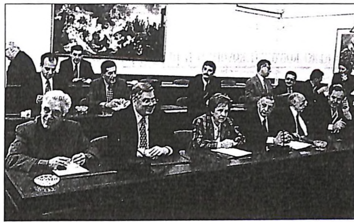
Τα διαδικαστικά συζητήσε χθες η Εξεταστική των Πραγμάτων Επιτροπή για την υπόθεση Οτσαλάν.