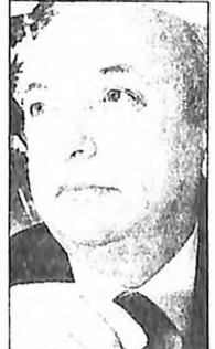
Δεν διασακούστηκε για τον ανασχηματισμό ο κ. Θ. Τσοκούκας

κ. Κ. Γεϊτόνα: «Να πεις στον Πάγκαλο να παρατηρήσει γιατί θα τον καθαρίσω!». Στα γραφεία τους οι υπουργοί καλούσαν επιμονώς όλα τα τριψήφια τηλέφωνα του Μεγάρου Μαξίμου και ουδείς απαντούσε. Επιφανές μέλος του Υπουργικού Συμβουλίου οργιστική ιδιαιτερέια: «Μα είναι δυνατόν να ξέρει ο Κηπουρός τι έγινε με αυτή την υπόθεση και να μην ξέρω εγώ». Ο Πρόεδρος της Βουλής κ. Α. Κακλαμάνης και ο υπουργός Επικρατείας κ. Κ. Γεϊτόνας κατέβηκαν ιδιαίτερες προσαρμογές και μετά δυσκολίας κατάφεραν να συγκρατήσουν τις εκδηλώσεις των βουλευτών που είχαν κληθεί να μεταφύγουν στην ψηφοφορία για την κύρωση της Συνθήκης του Αμστερνταμ, για την τύχη της οποίας ουδείς έδειχνε να ενδιαφέρεται.