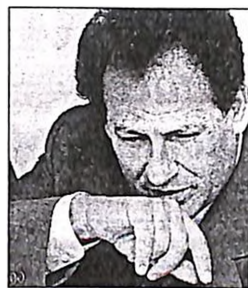
Αποφασιστική υπήρξε η παρέμβαση του κ. Λαλιώτη (επάνω) στις αποφάσεις του κ. Σημίτη για την απομάκρυνση των τριών υπουργών

στον Πρωθυπουργό να προχωρήσει αμέσως, και προτού ξεκινήσει η κοινή συνεδρίαση, τις παραίτησεις των τριών υπουργών. Η επιχειρηματολογία του κ. Λαλιώτη δεν συνδέθηκε με τυχόν ευθύνες τους, καθώς ξεκαθάρισε εξ αρχής ότι η πρότασή του αποσκοπούσε στη διαφύλαξη του κύρους των τριών υπουργών: « Μόνον έτσι θα τους αποσυνδέσουμε από την κραταιοποιημένη που έχει στήσει εναντίον τους μέσα και έξω από το ΠΑΣΟΚ. » φέρεται να είπε στον Πρωθυπουργό ο κ. Λαλιώτης. Το κύριο βάρος της επιχειρηματολογίας του υπουργού ΠΕΧΩΔΕ στηρίχθηκε αλλού: « Αν δεν δώσεις αυτή τη λύση, θα αναπλάξουμε το ήρεμο πολιτικό κλίμα που είναι αναγκαίο για την ομαλή πορεία της οικονομίας αλλά και για την όσο γίνεται πιο αποφορτισμένη διεξαγωγή του συνεδρίου και τη συνεπαιγμένη πορεία της παράταξης στις εκλογές. Θα έχουμε αλωσιότητα, πρόταση δυσπιστίας για τον Πάγκαλο, μετά εξεστρατική επιτροπή, μετά θα ζητάνε με βάση κάθε κατάσταση κάποιον ο Θεός ξέρει τι και ποιανού πρόκτορα της ΕΥΠ την παραίτηση του Αλέκου κτλ. Θα μας κάνουν φέτες, στερώντας κάθε πιθανότητα ήρεμης και υπεύθυνης διακυβέρνησης, αν δεν δώσεις εντός τώρα τη λύση που θα προσφέρει τη βάση ανασύνταξης της κυβέρνησης και του χώρου αλλά και την ευκαρπία στον Θόδορο και στον Αλέκο να αντιπληθύνεται πολιτικά χωρίς τα "βαρίδια" ενός παγιωμένου από την εξέλιξη Οτσαλάν αξιωματός» φέρεται να είπε στον Πρωθυπουργό ο υπουργός ΠΕΧΩΔΕ.