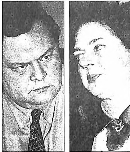
Ο νέος υπουργός Ανάπτυξης κ. Ευ. Βενιζέλος και η προκάτοχός του κυρία Βάσω Παπανδρέου θα πρωταγωνιστήσουν στη «μετά Σημίτη εποχή»

ΔΕΝ ΘΑ Εξαίσουμε ποτέ αυτό τον Φεβρουάριο. Και κυρίως δεν θα τον ξεχάσουμε ποτέ στο ΠαΣοΚ, όπου πλέον «τίποτε δεν έχει αλλάξει, τίποτε δεν είναι όπως παλιά». Το 5ο συνέδριο του Κινήματος στις 18 Μαρτίου γίνεται να λάβει χαρακτήρα αφητηρίας - πέραν πάσης αμφιβολίας, στην κρίση κομματικών στελεχών όλων των αποχρώσεων - για τη «μετά Σημίτη εποχή». Στη Χαρ. Τρικούπη φοβούνται τώρα ότι οδεύουν «προς το συνέδριο του Οτσαλάν» και είναι προφανές ότι μετά τις τελευταίες εξελίξεις αλλάζουν τα δεδομένα του συνεδρίου και εν μέρει παίρνει άλλες αποχρώσεις το ευκομματικό τοπίο.