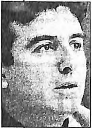
Μ. Χρυσόχοιδης, ο ριψοκίνδυνος