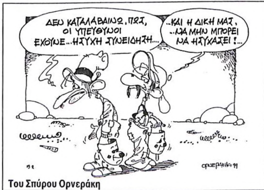
Του Σπύρου Ορνεράκη

Είχε πάει τρεις το πρωί όταν εντοπίζεται τηλεφωνικά ο Έλληνας πιλότος του αεροσκάφους που μετέφερε στην Ελλάδα τον Οτζαλάν. Χωρίς περιστροφές επιβεβαίωσε αυτό που για οκτώ ώρες δεν ήταν σε θέση να πράξουν οι αρμόδιες υπηρεσίες του κράτους! «Ναι, αυτός που ζητάτε είναι ο Οτζαλάν, δεν ξέρω τώρα πού δρισκεται!»