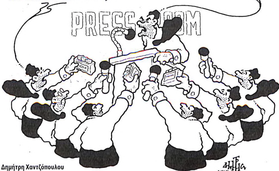
Του Δημήτρη Χαντζόπουλου