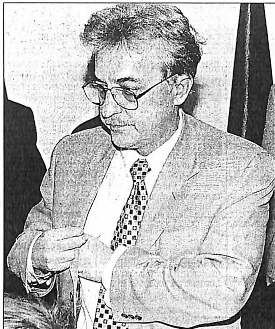
Ο Αλέκος Παπαδόπουλος αποχωρεί μετά τη συνέντευξη Τύπου που έδωσε, όπου δήλωσε πως η δική του ευθύνη αφορά μόνο το γεγονός ότι η ΕΥΠ ανήκει διοικητικά στο υπουργείο του, ενώ κατά τ' άλλα δρα ως «ανεξάρτητη υπηρεσία».

Οι αρχές του Μινσκ, όπως μας ενημέρωσαν, δεν έδωσαν άδεια υπερπτήσης από τη Ρίεκα στο Μινσκ, με αποτέλεσμα να επιστρέψει το αεροπλάνο στο Ανατολικό αεροδρόμιο. Εκείθεν και για λόγους μυστικό-