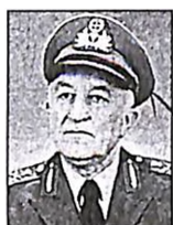
Του Γ. ΣΕΙΡΑΔΑΚΗ αντιστρατήγου ε.σ.

ΓΙΑ ΝΑ ΔΙΚΑΙΟΛΟΓΗΣΕΙ το ρόλο της περιφερειακής δυνάμεως έπεισε τους πάντες ότι αυτή έχει «το πάνω χέρι στην περιοχή», διότι: Αρχικά απείλησε τη Συρία με πόλεμο και την εξανάγκασε να εκδιώξει τον Οτσαλάν, «πεχρώσε όλες τις χώρες του κόσμου «με περιλαμβανομένης της μεγάλης, υποτιθέεται, Ρωσίας) να μην του παρέξει κανέναν στέγη. Επέτυχε να χρησιμοποιήσει ως όργανά της και επί «ωφελεία της τις μουσικές υπηρεσίες, των ΗΠΑ και του Ισραήλ.