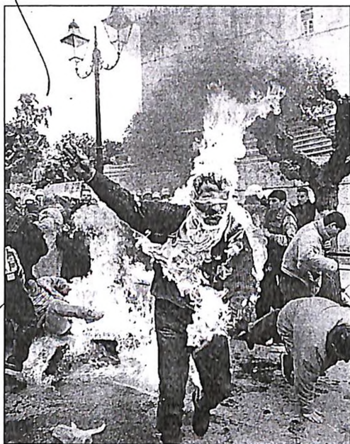
Οι Κούρδοι δεν μπορούν να συγχωρέσουν την Ελλάδα για τη σύλληψη του Οτσαλάν από τους Τούρκους. Και τώρα απειλούν με αντίποινα.

Στην ερώτηση της «Α» ποια χώρα επρόκειτο να χρησιμοποιήσει πολιτικό άσυλο στον Οτσαλάν, ο κ. Παπαδόπουλος αρνήθηκε να απαντήσει προφασίζόμενος ότι το θέμα είναι βασιμότητα πολιτικό και όχι αστυνομικό, ενώ δεν απάντησε στην ερώτηση, αν ο κ. Κοσμίδης συμφωνούσε με τις δικές του απόψεις ή μ' αυτές του υπουργού Εξωτερικών. Είπε, επίσης, ότι είχε ζητήσει τη σύλληψη του Αν. Ναξάκη.