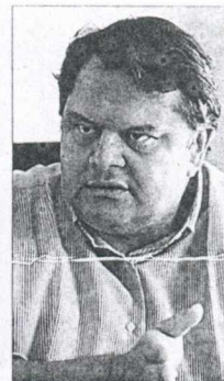
Ο Ευάγγελος Βενιζέλος

Ο ταν την περασμένη Τρίτη, αργά το απόγευμα, σχηματίζονταν οι πρώτες πολιτικο-δημοσιογραφικές «παρέες» στο καφεενίο της Βουλής, όλοι «προετοιμάζονταν» για μια μακριά, ηχητική νύχτα, η οποία θα έκλεινε με μια τυπική ψήφο εμπιστοσύνης προς την κυβέρνηση. Κανείς δεν μπορούσε να προβλέψει το ψυχοδράμα που θα ακολουθούσε, φέρνοντας τον πολιτικό κόσμο της χώρας στο «κείλος» των εκλογών.