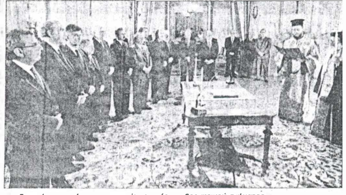
Στιγμιότυπο από την ορκωμοσία του νέου κυβερνητικού σχήματος.

Αιτέλεσε νομάρχης στην πρώτη οικιστία του ΠΑΣΟΚ, ενώ υπήρξε ένας εκ των «απαραγκών» του Γεράσιμου Αράνη. Μετά την ήττα του υπουργού Παιδείας στην Κ.Ο., προσχώρησε στο εκσυγχρονιστικό σενάριο του ηρωκλήνους αρνητικά στέλεχος. Υπήρξε και πάλι στο παρελθόν υπουργός Υγείας, στην τελευταία κυβέρνηση Παπανδρέου.