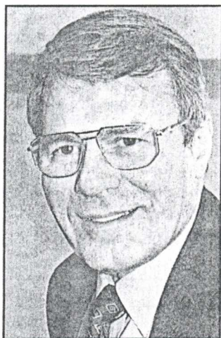
Κ. Στεφανής: Δεν δέχτηκε το Υγείας για λόγους υγείας

θος του μυαλού του κ. Σημίτη η ιδέα δεν είχε σβηστεί εντελώς. Είναι προφανές ότι ο ίδιος δεν τον ήθελε, αλλά έβλεπε ότι η κατάσταση που είχε δημιουργηθεί δεν εκτονωνόταν. Την Πέμπτη το μεσημέρι συνάντησε τον πρωθυπουργό της Σλοβενίας. Ο τελευταίος υπουργός που είδε ήταν ο Εμπορικής Ναυτιλίας Σταύρος Σουμάκης , ο οποίος πήρε μέρος στη συνάντηση των δύο πρωθυπουργών. Δεν του έβλεπε τίποτα.