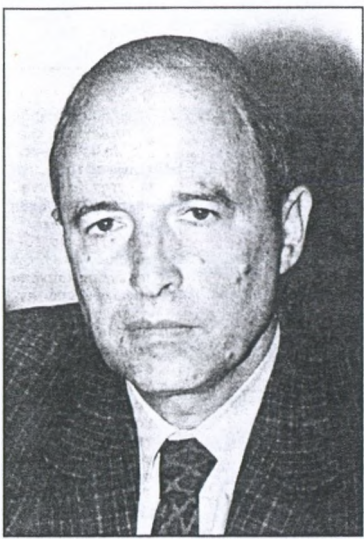
Αποφασισμένος να βάλει τάξη στο χάος της ασφαλιστικής αγοράς δηλώνει ο υπουργός Εμπορίου κ. Κ. Σημίτης με πρώτη δυναμική κίνηση την ανάκληση της άδειας λειτουργίας τριών εταιριών στις αρχές του καλοκαιριού. Μόνο που η ελληνική ασφαλιστική αγορά μοιάζει λίγο με τη Λερναία Ύδρα.