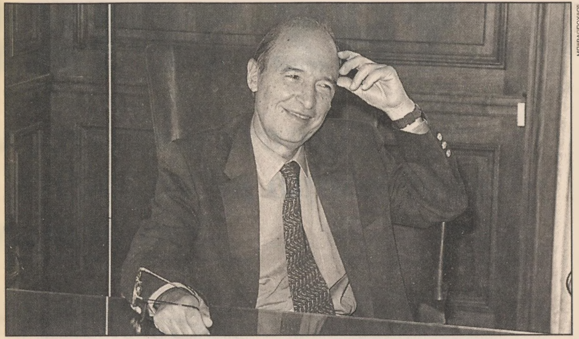
Με καλή διάθεση και με προσοχή, πάντα ο κ. Κων. Σημίτης θέλει να ακούει τις απόψεις των συνεργατών και των φίλων του. Μια «συνήθεια» ζωής που δεν άλλαξε όταν εξελέγη πρωθυπουργός.