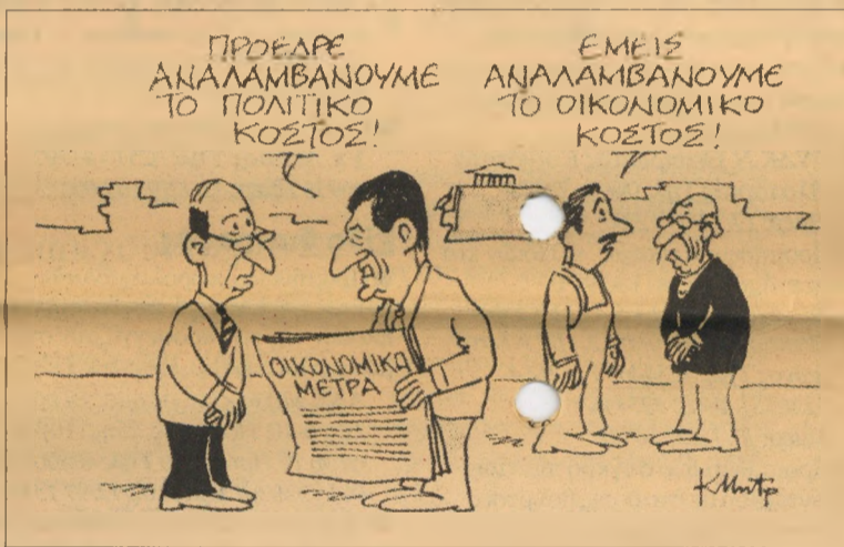
Του Κώστα Μητρόπουλου από «ΤΑ ΝΕΑ»

◀ Ο Κ. Σημίτης, πάντως, προς το παρόν βρίσκεται στο Λουξεμβούργο όπου έχει να αντιμετωπίσει μαζί με τους άλλους 14 ηγέτες των χωρών της