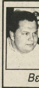
Του Ευάγγελου Βενιζέλου

σία μία συζήτηση για ανεθώρηση των σχετικών συνταγματικών διατάξεων, μ' όλη την προσοχή και την οικονομία κινήσεων που απαιτεί η παρέμβαση σ' ένα κείμενο αυστηρό και ελλειπτικό όπως το Σύνταγμα.