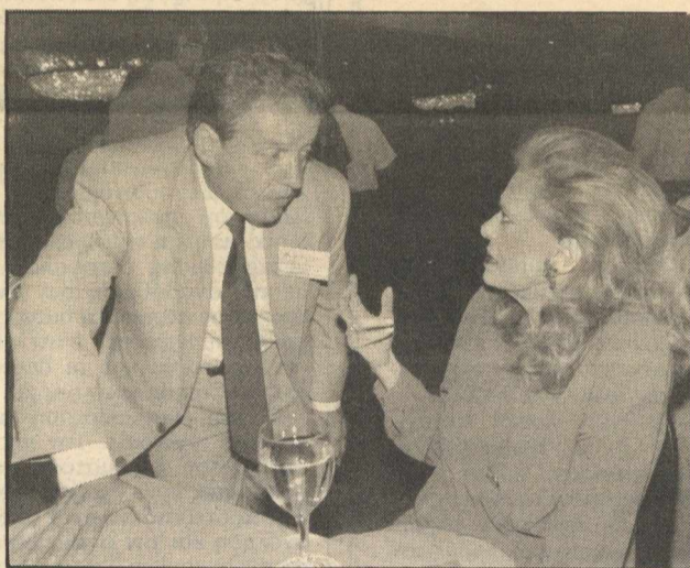
Μελίνα και Παπαθεμελής τα λένε στην έναρξη

— Ένα κράτος αποκεντρωμένο, με την περιφέρεια κέντρο διοικητικών αποφάσεων, μοχλό ανάπτυξης, αλλά και θεσμό δημοκρατικής συμμετοχής των πολιτών στο επίπεδο των Περιφερειακών Συμβουλίων.