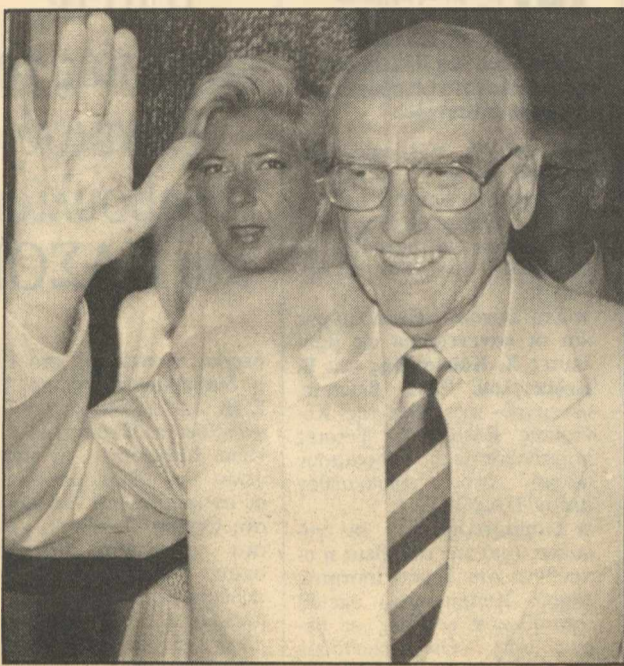
Νέα διακήρυξη από τον Α. Παπανδρέου

Αναγνωρίζοντας ότι σήμερα κυριαρχούν «η αδράνεια, ο εφησυχασμός και οι ιδιοτελείς πρακτικές», ο πρόεδρος του ΠΑΣΟΚ έκανε έκκληση κυρίως στους νέους, που «θέλουν να ζήσουν τη ζωή ως δημιουργοί