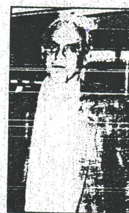
Αιχς: Και ο πρόεδρος ήξερα για τις ανακοινώσεις

Κ. ΣΗΜΙΤΗΣ: Παύτως κι το Γραφείο Τύπου του ΠΑΣΟΚ θα έπρεπε με πολλή περιέργεια να εκδίδει ανακοινώσεις, όπως δήλωσα και στη συνεδρίαση, σε σχέση με μέλη του Ε.Γ. Θα έπρεπε προηγουμένως να υπάρχει μια συνεννόηση με το ίδιο το Ε.Γ. και πιστεύω ότι η ενέργεια αυτή ήταν λανθασμένη.