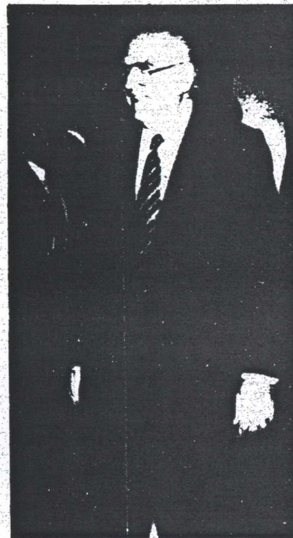
...Χαμόγελα διαφορετικών κινήτρων.

1) Ο Πρωθυπουργός εάν δεν ήθελε να οδηγήσει σε παραίτηση τον κ. Σημίτη μπορούσε να εκτονώσει τις αντιδράσεις στα εισοδηματικά μέσα από μία διαδικασία διαλόγου με την ΓΣΕΕ και την ΑΔΕ ΔΥ που θα οδηγούσε σε μία διόρθωση της όντας λαθεμένης πράξεως του ετεροχρονισμού. Αντίθετα απέρριψε τέτοιες προτάσεις που του έγιναν και επέλεξε την πρωτοφανή πράξη της αποδοκιμασίας του Υπουργού του από το βήματος της Βουλής ΣΥΝΧΕΙΡΙΑ ΣΤΗΝ 10η ΣΕΛ.