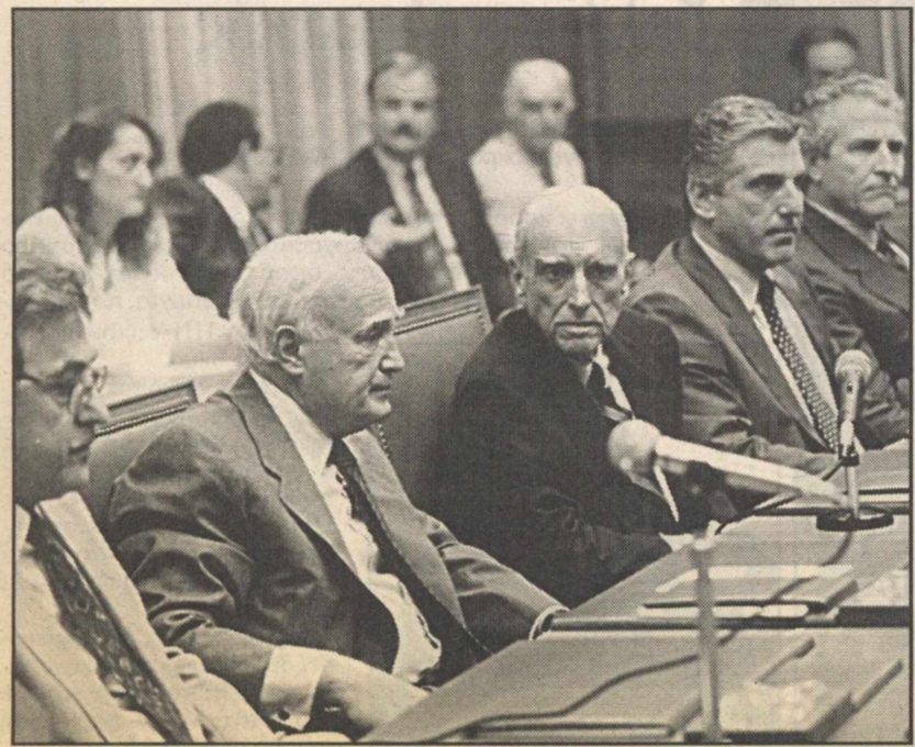
Μια συνεδρίαση ανά δύομηνη μήνες για το υπουργικό συμβούλιο. Η παλιά δέσμευση μιλούσε για συνεδριάσεις κάθε 15ήμερο

ενισχύουν και διευρύνουν την εσωκομματική δημοκρατία». Φαίνεται ότι δεκαπέντε μέρες αργότερα, όταν είχε αρχίσει τις εργασίες του το συνέδριο, το ξανασημείωσε και ίσως διαπίστωσε ότι πολιτική ενόπια με εσωκομματική δημοκρατία είναι έννοιες που δεν μπορούν να χωρέσουν μαζί στο δικό του κόμμα. Έτσι, μολοντί δεν διαθέτει και πληθώρα ικανών στελεχών (κα-