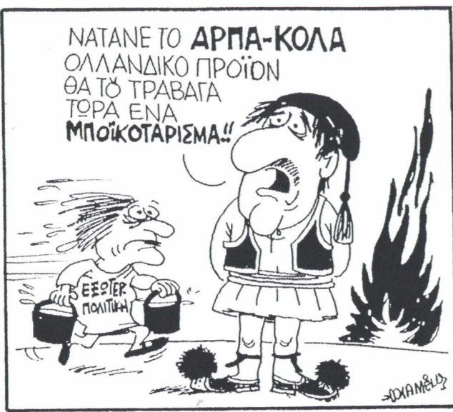
του ΑΛΕΞΗ ΚΑΜΕΝΙΤΣΗ