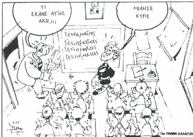
Του ΓΙΑΝΝΗ ΚΑΛΑΜΙΤΗ

Επισημαίνοντας την απόφαση Παπανδρέου ο γένη του Έμμανουελ Γεννημάτας τον Γρηγόριο Χυτήρη υποστήριξε ότι δεν υποβαθμίζεται ο Γ. Γεννημάτας, και ότι, αντίθετα, «αναβαθμίζεται το στεφανιστικό πρόβλημα, στο οποίο θα προσφέρει τον ορισμό ο πρόεδρος του κόμματός». Και πρόσθεσε ότι η