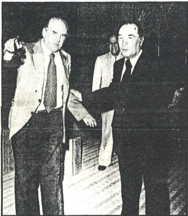
Με τον Α. Παπανδρέου, το Χ. Φλωράκη και τον Κ. Σημίτη πριν από δεκαετίες. Ο γάλλος πρόεδρος είχε καλές σχέσεις σχεδόν με όλους τους έλληνες πολιτικούς.