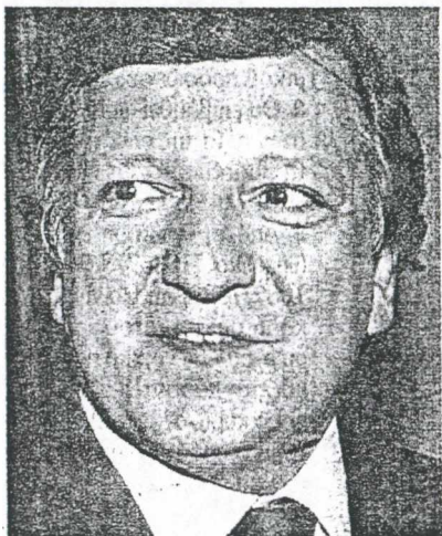
Ο κ. Ζοζέ Μανουέλ Μπαρόζο (αριστερά) το 2002 έδειξε πρώτος τον δρόμο της απογραφής και δύο χρόνια αργότερα τον ακολούθησε ο κ. Γ. Αλογοσκούφης

Ο συντάκτης του άρθρου αναφέρεται όσα στην απογραφή που επιχείρησε το 2002 ο τότε κεντροδεξιός πρωθυπουργός της Πορτογαλίας και σήμερα πρόεδρος της Ευρωπαϊκής Επιτροπής Ζοζέ Μανουέλ Μπαρόζο. Η απογραφή αυτή είχε δείξει το πραγματικό δημοσιονομικό έλλειμμα που είχε κληροδοτήσει στην κυβέρνηση Μπαρόζο η προηγούμενη σοσιαλιστική κυβέρνηση έφθανε στο 4,2%. Η Πορτογα-