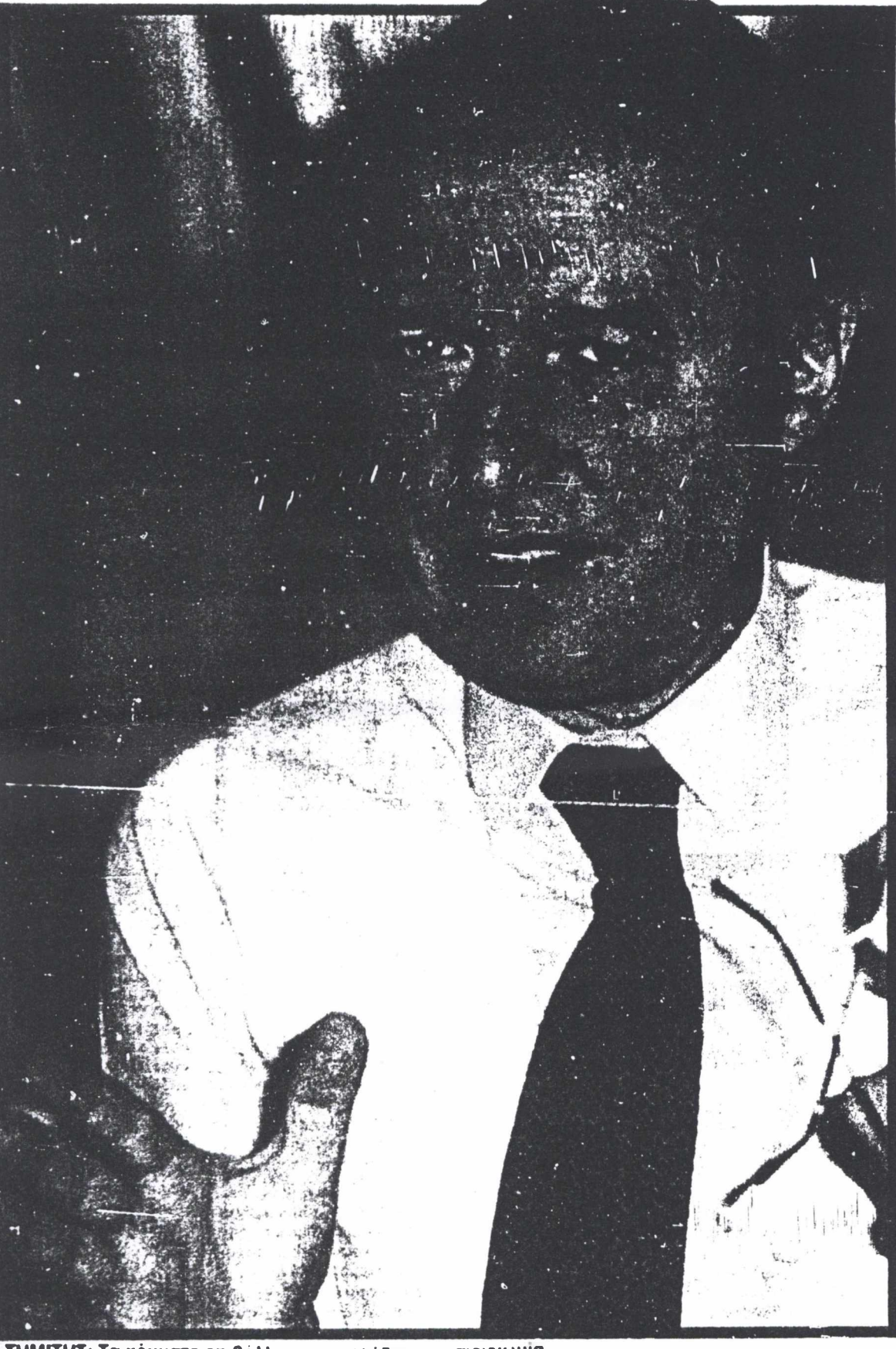
ΣΗΜΙΤΗΣ: Το κόμμα επιβάλλεται να αλλάξουν φυσιογνωμία.

Οι πολιτικοί πρέπει να καθοδηγούνται από τις ιδέες τους. Όχι από το τι λέει ο κόσμος