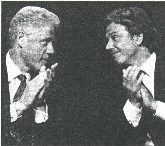
Κλίντον-Μπλερ: ο αγγλοσαξονικός άξονας της Κεντροαριστεράς