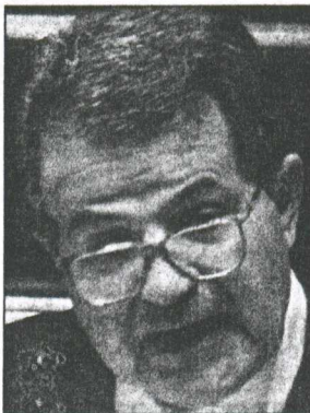
Πρόντι-Καρντόζο: Η λατινική παρουσία στη Νέα Υόρκη