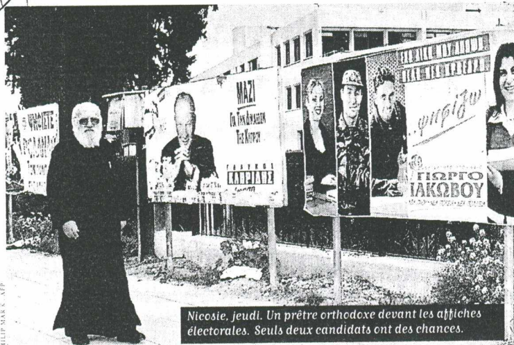
PHILIP MARX - AFP