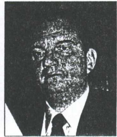
Τον κώδωνα του κινδύνου για την επεκτατική πολιτική της Τουρκίας έκρουσε χθες μιλώντας στη συνεδρίαση της κοινοβουλευτικής ομάδας ο πρόεδρος της Ν.Δ. κ. Κ. Καραμανλής.

Χάγη: Για την προσφυγή στη Χάγη είπε ότι «η αποδοχή της γενικής δικαιοδοσίας του δικαστηρίου αποτελεί υποχρέωση κάθε χώρας». «Δεν μπορεί να παραιοιόζεται ως δήθεν τουρκική παραχώρηση και ακόμα είναι λάθος να το προτείνει η Ελλάδα. Η πάγια θέση είναι ότι το Διεθνές Δικαστήριο πρέπει να επιληφθεί του θέματος της οριοθέτησης της υφαλοκρηπίδας,