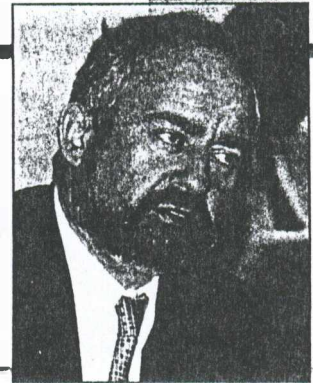
Δημήτριος Κωνσταντίνος, πρόεδρος εκ προσωπικοτήτων, επικεφαλής της μόνιμης ελληνικής αντιπροσωπείας στο Συμβούλιο της Ευρώπης.

Ενα τέτοιο θέμα δεν μπορεί να συζητηθεί παρά μόνο όταν όλοι οι λόγοι που οδήγησαν σε στρατικοποίηση αρθούν (αξιώσεις σε Αιγαίο, Κυπριακό) και πάνω στη βάση της αμοιβαιότητας.