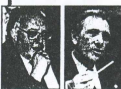
Ο Έλληνας πρώην υπουργός Εξωτερικών και ο Τούρκος σμόγγος του Ισραήλ Τζεμ, δύο από τους πρωταγωνιστές των τελευταίων χρόνων στις διαπραγματεύσεις για την προσφυγή ή όχι στο Διεθνές Δικαστήριο.

Η διαμόρφωση των επιτηρημάτων του Αιγαίου Δικαστηρίου μπορεί να επιρροαστεί άμεσα ή έμμεσα από τις εκάστοτε ισχυρότερες χώρες, δηλαδή σήμερα από τις δικές.