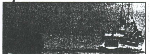
28 Μαρτίου 1987. Πολεμικό του τουρκικού ναυτικού συνοδεύει το «Σιμίκ» στην έξοδό του από τα Στενά στο Αιγαίο.

Στον βαθμό που η Ελλάδα εμφανίζει στη θέση της ότι μόνο η οραθή τηση της υφαλοκρηπίδας στο Αιγαίο είναι αποδεκτή ως διμερής, ελληνοτουρκική διαφορά, τότε προφανώς δεν τίθεται ζήτημα. Εάν η στάση αυτή μεταβληθεί στο Δικαστήριο, δεν αποκλείεται εντελώς και κάποια εξισορρόπηση μεταξύ αποφάσεων.