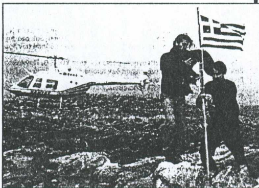
Δημοσιογράφος της Χουριέτ με τον πιλότο του ελικοπτερου κατεβάζουν την ελληνική σημαία στη βραχονησίδα Ιμί.

1 Εξυπηρετεί τα ελληνικά συμφέροντα η παραπομπή όλων των ελληνοτουρκικών διαφορών στο Δικαστήριο της Χάγης, συμπεριλαμβανομένων και των τουρκικών μονομερών αξιώσεων, οι οποίες ουδέποτε έχουν γίνει αποδεκτές από την Ελλάδα;