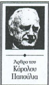
Άρθρο του Κάρουλου Παπούλια

Οι τελευταίες επαφές υψηλού επιπέδου της ελληνικής πολιτικής ηγεσίας με τον Πρωθυπουργό της Τουρκίας και τον Πρόεδρο των ΗΠΑ, η επικείμενη έναρξη εκ του σύνεγγυς συνομιλιών για το Κυπριακό και η Σύνοδος Κορυφής των «15» στο Ελσίνκι δίνουν, νομίζω, την ευκαιρία για να γίνει μια αποτίμηση της σημερινής κατάστασης των Ελληνοτουρκικών σχέσεων και των προοπτικών τους. Θέλω να τονίσω ότι θεωρώ πως οι σχέσεις φίλας, καλής γειτονίας και ειρηνικής συνύπαρξης μεταξύ της Ελλάδας και της Τουρκίας είναι προς το συμφέρον των δύο χωρών και των δύο λαών και της σταθερότητας στην ευαίσθητη περιοχή της ΝΑ Μεσογείου. Κατά τις τελευταίες δεκαετίες, οι ελληνοτουρκικές σχέσεις δοκιμάζονται με εναλλασσόμενες περιόδους μεγαλύτερης ή μικρότερης έντασης. Στη βάση της κατάστασης αυτής είναι, αναμφίβολα, η τουρκική εισβολή και κατοχή μεγάλου τμήματος της Κυπριακής Δημοκρατίας, αλλά και η αμφισβήτηση ελληνικών κυριαρχικών δικαιωμάτων στο Αιγαίο που απορρέουν από το Διεθνές Δίκαιο και τις Διεθνείς Συνθήκες.