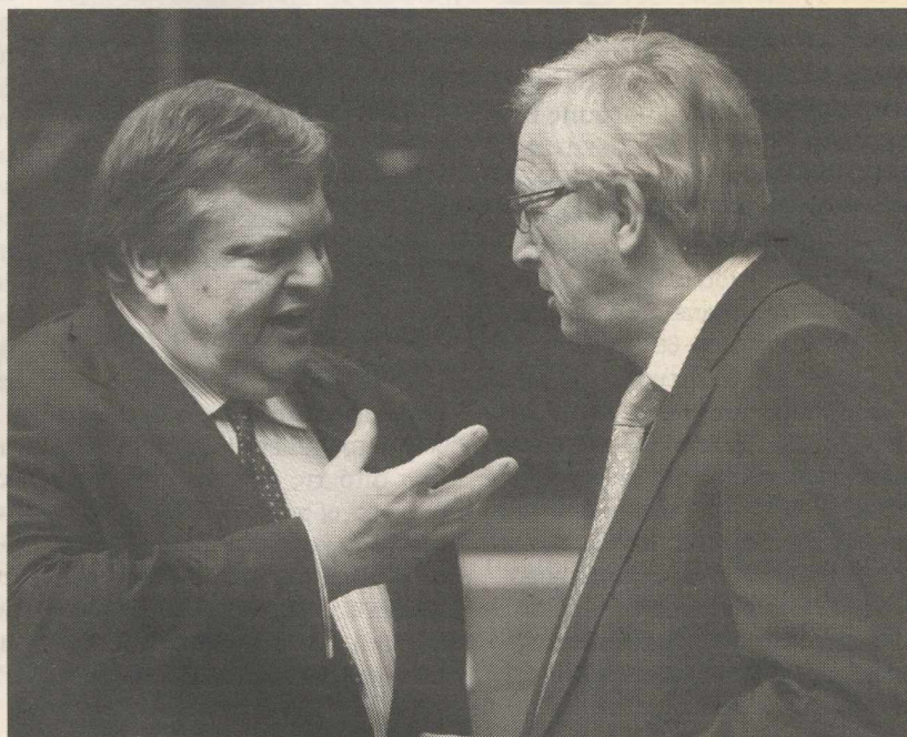
Την αισιοδοξία του για την τελεσφόρηση του PSI εξέφρασε ο υπουργός Οικονομικών Ευ. Βενιζέλος προσερχόμενος στο χθεσινό Eurogroup στις Βρυξέλλες: «...Έχουμε πολύ εποικοδομητική συνεργασία με τον ιδιωτικό τομέα και είμαστε έτοιμοι να ολοκληρώσουμε την όλη διαδικασία εγκαίρως»

Πέραν των άλλων, Αθήνα και θεσμικοί πιστωτές ευελπιστούν να αυξηθεί το ποσοστό της εθελοντικής συμμετοχής στο PSI, η οποία σύμφωνα με τις τελευταίες πληροφορίες δεν υπερβαίνει τα δύο τρίτα, με πολλούς τρόπους, από την «πειθώ» των θεσμικών πιστωτών μέχρι ακόμη και από το δέλεαρ των 14,4 δισ. ευρώ που περιμένουν να εισπράξουν οι τράπεζες τον Μάρτιο από τις λήξεις ελληνικών ομολόγων (όπως άλλωστε και των επομένων μηνών), όταν μάλιστα η καγκελάρια Μέρκελ αποκλείει την πρόβλεψη «δανειακής γέφυρας» μεταξύ των δύο πακέτων διάσωσης, καθώς άτακτη χρεωκοπία θα σημαίνει