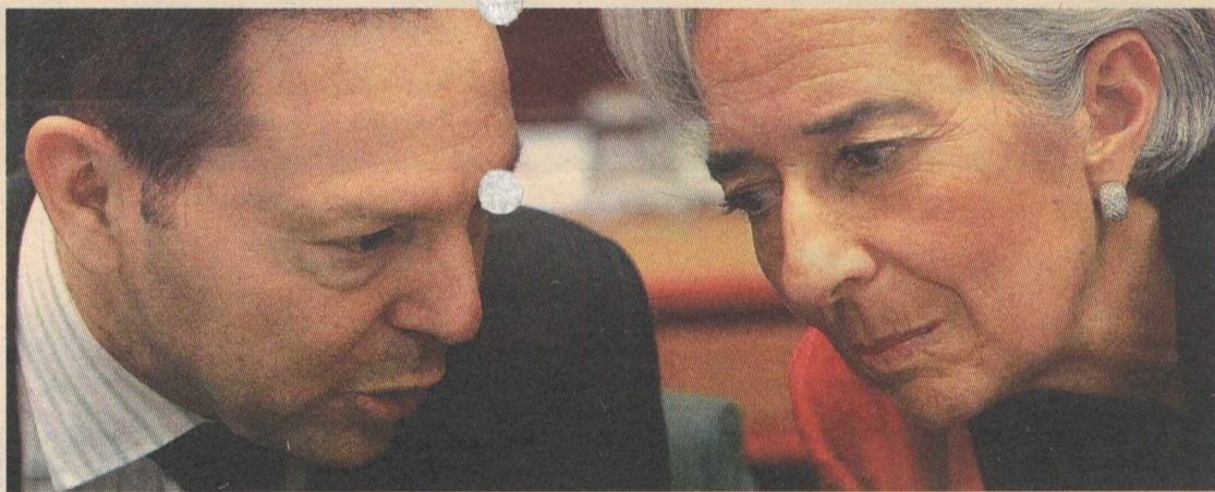
Στουρνάρας - Λαγκάρντ στο χθεσινό Eurogroup όπου ήταν πολλές οι θετικές αναφορές για την Ελλάδα