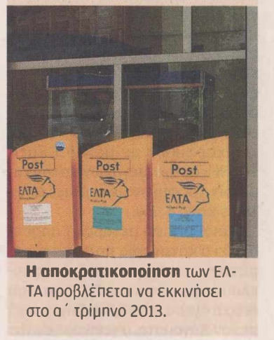
Η αποκρατικοποίηση των ΕΛΤΑ προβλέπεται να εκκινήσει στο α' τρίμηνο 2013.

Πιο σφικτό χρονοδιάγραμμα υλοποίησης των αποκρατικοποιήσεων περιλαμβάνει η νέα έκδοση του Μνημονίου που δόθηκε στη δημοσιότητα. Σύμφωνα με τη νέα έκδοση (27/11/2012), επιταχύνονται οι περισσότερες αποκρατικοποιήσεις που έχει αναλάβει το Ταμείο Αποκρατικοποιήσεων (ΤΑΙΠΕΔ) σε σχέση με το αρχικό σχέδιο που είχε δοθεί στη δημοσιότητα στις 10/11/2012. Ειδικότερα, οι αποκρατικοποιήσεις των ΤΡΑΙΝΟΣΕ, ΕΛΤΑ, ΟΔΙΕ, Διεθνούς Αερολιμένα Αθηνών (ΔΑΑ) κ.ά. αναμένεται να εκκινήσουν ένα ή δύο τρίμηνα νωρίτερα απ' ό,τι προέβλεπε το προηγούμενο σχέδιο. Η αποκρατικοποίηση των ΕΛΤΑ τώρα προβλέπεται να εκκινήσει στο α' τρίμηνο 2013, αντί το β' τρίμηνο που προβλεπόταν αρχικά, ενώ η έναρξη της αποκρατικοποίησης της ΤΡΑΙΝΟΣΕ προβλέπεται να εκκινήσει στο β' τρίμηνο αντί του δ' τρίμηνου. Επίσης, κατά ένα τρίμηνο επιταχύνεται η έναρξη της διαδικασίας αποκρατικοποίησης των λιμανιών, των περιφερειακών αεροδρομίων, ενώ η (επαν)έναρξη της αποκρατικοποίησης του ΔΑΑ συντομεύεται κατά δύο τρίμηνα. Από την άλλη πλευρά, φαίνεται να υπάρχουν και κάποιες αποκρατικοποιήσεις που ολισθαίνουν χρονικά. Η έναρξη, για παράδειγμα, της αξιοποίησης της Εγνατία Οδού υποχωρεί κατά ένα τρίμηνο, και πλέον υποθετείται στο β' τρίμηνο του 2013. Ωστόσο, αυτό ίσως αποτελεί εξαίρεση στον κανόνα, που θέλει τη συντόμηση του χρόνου έναρξης των αποκρατικοποιήσεων.