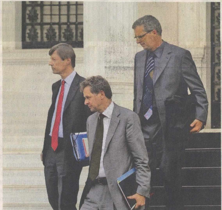
«Χρηματοδοτικά θέματα θα συζητηθούν μεταξύ των επίσημων δανειστών και της Ελλάδας», αναφέρει η ανακοίνωση της τρόικας.

Παράλληλα, στην ανακοίνωσή της η τρόικα επισμαίνει ότι υπάρχει συμφωνία στα περισσότερα θέματα με την ελληνική πλευρά, αλλά παραμένουν ανοικτά ζητήματα που θα πρέπει να διευθετηθούν τις επόμενες μέρες (εργασιακά, απελευθέρωση επαγγελματιών, απολύσεις στο Δημόσιο κ.λπ.). Σύμφωνα με στελέχη της τρόικας, σε τεχνικό επί-