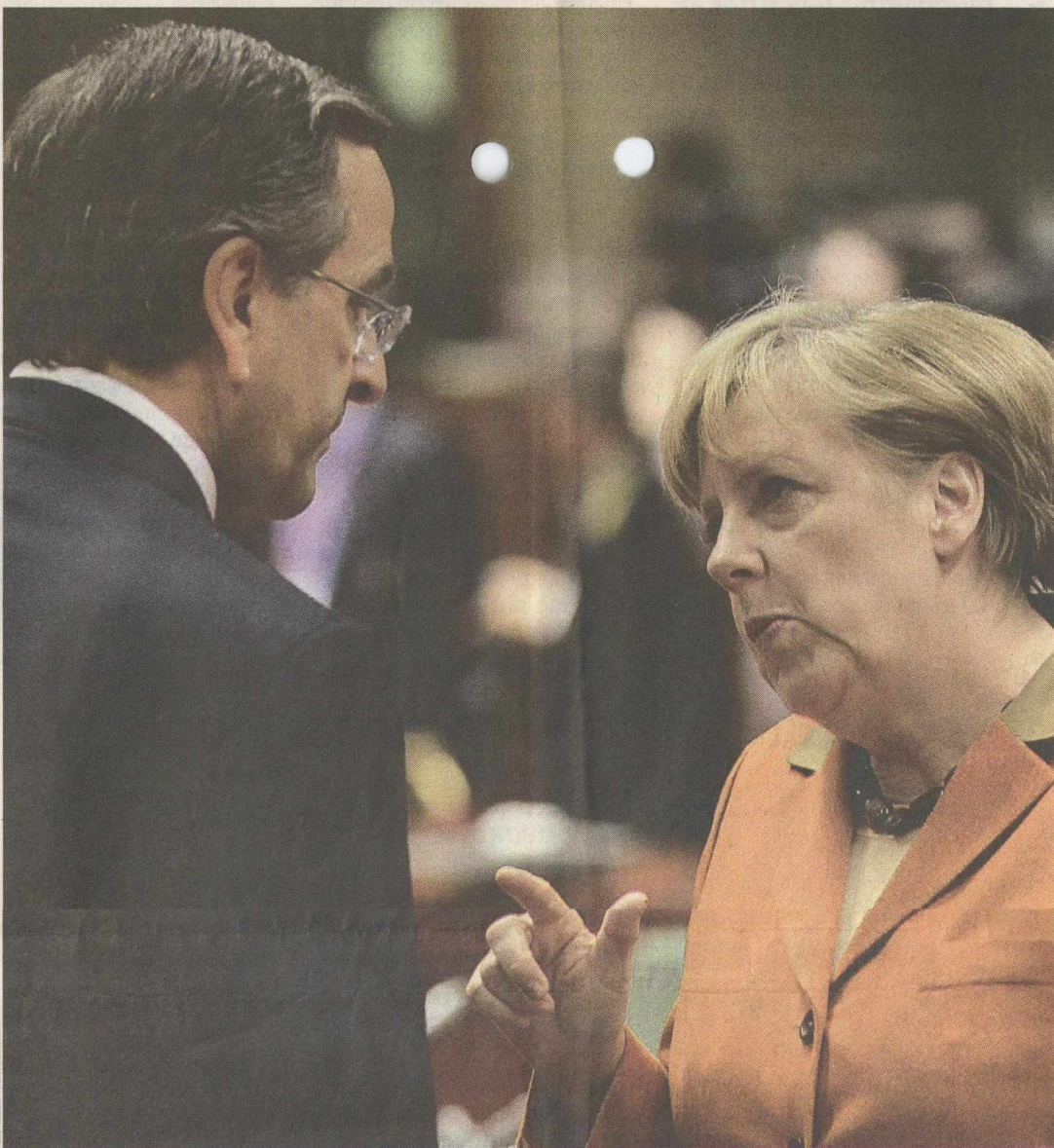
Ο Έλληνας πρωθυπουργός Αντ. Σαμαράς συνομιλεί με τη Γερμανίδα καγκελάρη Άγκελα Μέρκελ, στο περιθώριο της Συνόδου Κορυφής των «27», στις Βρυξέλλες.

Ο Γιούργκεν Μίχελς, οικονομολόγος της Citigroup, εκτιμά ότι η αλλαγή της γερμανικής κυβέρνησης στον ζήτημα της Ελλάδας συνδέεται με την ανησυχία της για πιθανή χρεοκοπία της χώρας, μεσούσης της προεκλογικής εκστρατείας στη Γερμανία. Γι' αυτό, άλλωστε, δεν αποκλείει ένα Gxexit το α' εξάμηνο του 2014. Γερμανοί αναλυτές επιμένουν να βαδίζουν στην οδό της απαισιοδοξίας. Ο Β. Μουνκάου πιστεύει ότι δύο είναι τα πιθανά μελλοντικά σενάρια για την Ευρωζώνη: είτε η διάσπασή της με την υιοθέτηση ενός ευρώ του Βορρά και ενός του Νότου, είτε μια πολιτική ένωση, επίκεντρο της οποίας θα αποτελέσουν η δημοσιονομική και τραπεζική ένωση. Κατά τον κ. Μουνκάου, οι τελευταίες προτάσεις του Βερολίνου «καλύπτουν ένα ελάχιστο τμήμα αυτής της ένωσης».