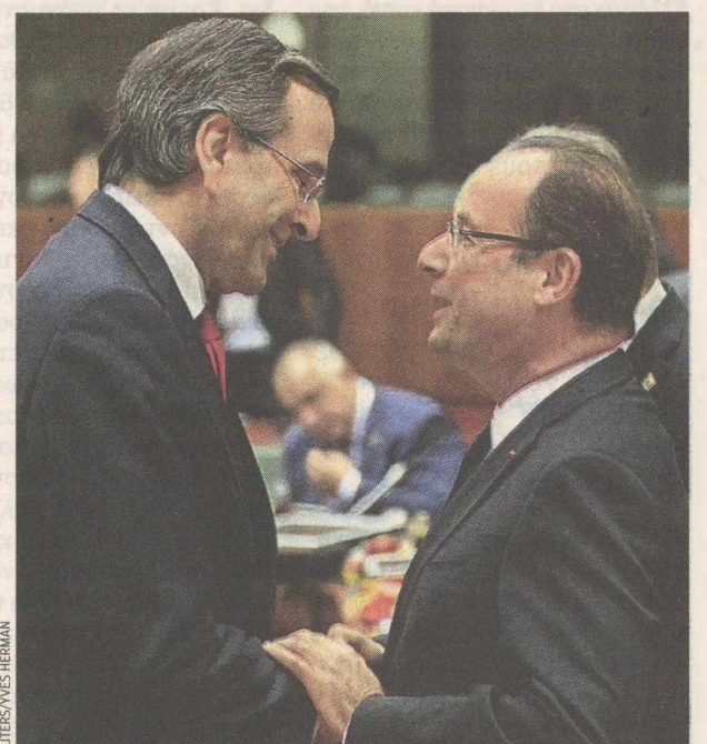
Το ελληνικό ζήτημα πρέπει να διευθετηθεί οριστικά, υπογράμμισε σε συνέντευξή του ο Γάλλος πρόεδρος Φρανσουά Ολάντ.

λία οι γαλλικές τράπεζες. Σύμφωνα με όλα τα εν λόγω ινστιτούτο, αθροιστικά η μείωση ΑΕΠ για το 2013 θα έφθανε στο 154%, με μόνο την Ιταλία να καταγράφει μείωση του ΑΕΠ της κατά 75% για το επόμενο έτος. Τα αντίστοιχα ποσοστά μείωσης του ΑΕΠ θα ήταν 69% για τη Γερμανία, 25% για τις ΗΠΑ και 49% για την Κίνα. Μια μείωση του ΑΕΠ τέτοιας κλίμακας θα προκαλούσε εκτίναξη της ανεργίας, με το ποσοστό της Γερμανίας για το 2015 και το 2016 να αυξάνεται κατά 2,5% και κατά 2,2% αντιστοίχως. Στη συνέχεια, το χρονικό διάστημα από το 2017 έως το 2020 η ανεργία στη Γερμανία θα ήταν υψηλότερη από τα προβλεπόμενα με τα σημερινά δεδομένα επίπεδα, από 0,5% έως 1,7%.