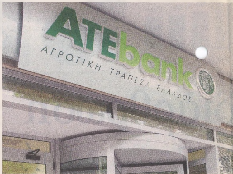
Η μεταβίβαση έκλεισε αργά χτες το απόγευμα, και η Τράπεζα Πειραιώς ήταν και η μόνη που κατέθεσε δεσμευτική πρόταση για την απορρόφηση της ΑΤΕbank.

Από τη Δευτέρα, όλο το δίκτυο των καταστημάτων της Αγροτικής