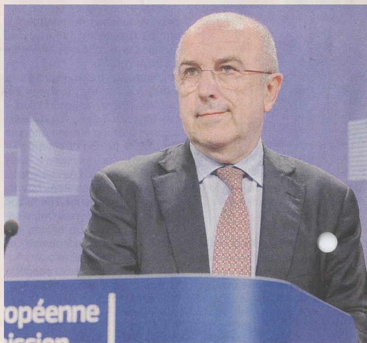
«Η προσωρινή ανακεφαλαιοποίηση από το ΤΧΣ διασφαλίζει τη σταθερότητα του ελληνικού τραπεζικού συστήματος», δήλωσε ο επίτροπος για τον Ανταγωνισμό, Χοακίν Αλμόνια.

Ταυτόχρονα, η Ευρωπαϊκή Επιτροπή ανακοίνωσε ότι ξεκίνησε έρευνα για να διαπιστώσει κατά πόσον το μέτρο είναι σύμφωνο με τους κανόνες της Ε.Ε. στον τομέα