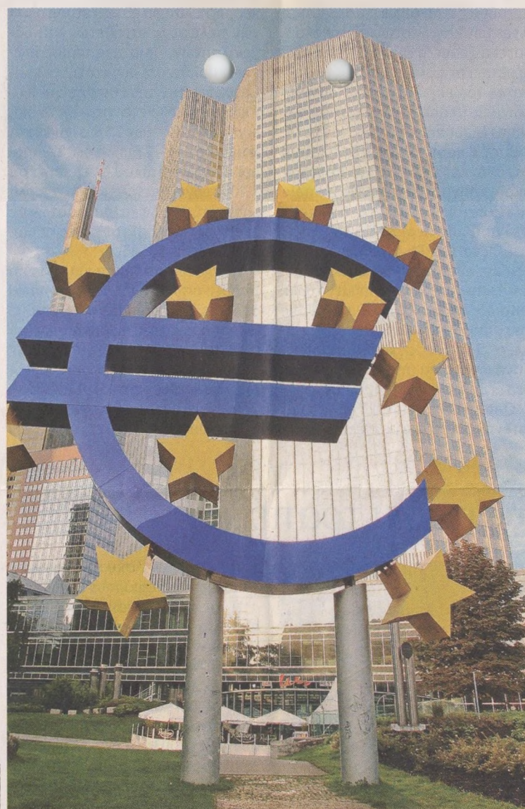
Το «κούρεμα» των ελληνικών ομολόγων που κατέχει η Ευρωπαϊκή Κεντρική Τράπεζα, εφόσον συμβεί, θα βοηθήσει και στην πτώση των επιτοκίων Ισπανίας και Ιταλίας.

Μία από τις επιλογές που εξετάζονται σε σχέση με το νέο ελληνικό «κούρεμα» είναι να απομειωθεί κατά 30% η αξία των ελληνικών ομολόγων που κατέχει η ΕΚΤ και οι υπόλοιπες εθνικές κεντρικές τράπεζες. Η συνολική αξία των δανεικών που έχει λάβει η Ελλάδα από τον επίσημο τομέα, δηλαδή από τους εταίρους στην Ευρωζώνη, το ΔΝΤ και το προσωρινό Ευρωπαϊκό Ταμείο Χρηματοπιστωτικής Σταθερότητας, ανέρχεται σε 220-230 δισ. ευρώ. Συνεπώς ένα «κούρεμα» αυτών των δανεικών θα απέφερε λίγο περισσότερα από 70 δισ. ευρώ, ακόμη και 100 δισ. ευρώ ανάλογα με τη μέθοδο που θα εφαρμοστεί. Μάλιστα, αξιωματούχοι αναφέρουν ότι η ανάγκη να «κουρευτούν» και τα δάνεια από τον επίσημο τομέα εξετάστηκε και στο πλαίσιο της πρώτης αναδιάρθρωσης του Μαρτίου, ωστόσο απορρίφθηκε ως πολύ δύσκολο να γίνει αποδεκτή πολιτικά.