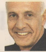
ΤΟΥ ΓΕΡΑΣΙΜΟΥ ΓΕΩΡΓΙΑΤΟΥ

Η απόφαση της Ευρωπαϊκής Κεντρικής Τράπεζας να προχωρήσει σε απεριόριστη αγορά κρατικών ομολόγων από τη δευτερογενή αγορά για τη χρηματοδότηση των ελλειμμάτων με μειωμένα επιτόκια, κρινόμενη με ρεαλισμό, μπορεί να αποτελέσει μικρό βήμα για την οικονομία αλλά πολιτικό άλμα για το σύνολο της ευρωζώνης. Όπως όλα στην Ευρώπη, είναι αποτέλεσμα διαπραγματεύσεως και συμβιβασμού. Για να κα-