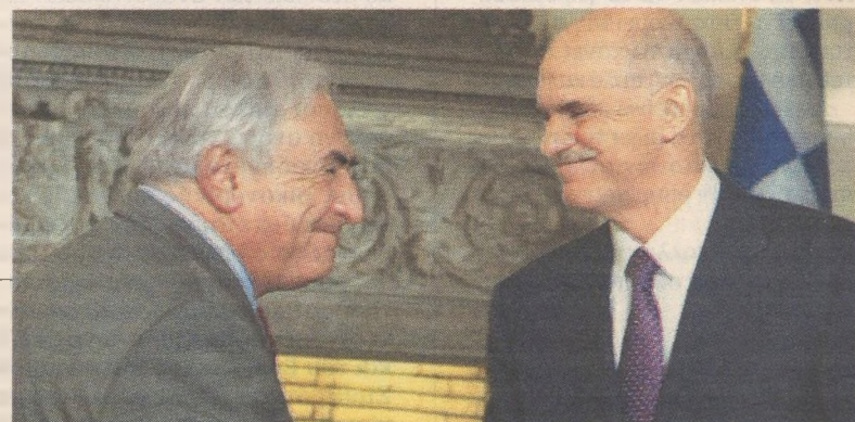
Ο Παναγιώτης Ρουμελιώτης με τον Ανδρέα Παπανδρέου σε χαλαρή κουβέντα. Ο πρώτος υπήρξε μέλος των κυβερνήσεων του ΠΑΣΟΚ την περίοδο 1981-1989, με τελευταίο αξίωμα αυτό του υπουργού Εθνικής Οικονομίας. Οι στενοί δεσμοί του με την οικογένεια διερράγησαν πρόσφατα ύστερα από δηλώσεις του για τον τρόπο διαχείρισης ελλειμμάτων και χρέους