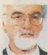
ΤΟΥ ΠΑΝΟΥ ΚΑΖΑΚΟΥ

Ο ι ανακοινώσεις Ντράγκι έδειξαν για άλλη μια φορά ότι το θεσμικό σύστημα και η πολιτική στην ΕΕ εξελίσσονται κάθε φορά που αντιμετωπίζουν κρίσεις. Οι ανακοινώσεις του επικεφαλής της Ευρωπαϊκής Κεντρικής Τράπεζας (ΕΚΤ) συμπληρώνουν σειρά άλλων πρόσφατων πρωτοβουλιών όπως π.χ. της αναπτυξιακής δέσμης του Ιουλίου 2012 και των