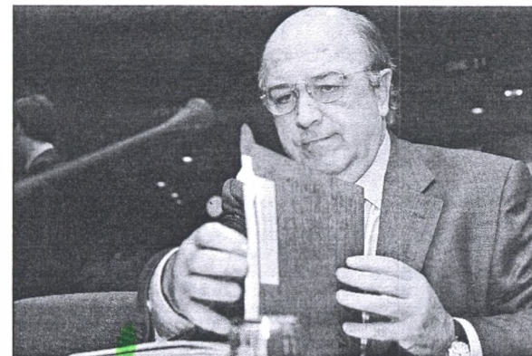
Μεταξύ της παραγράφου 7 και 9 του άρθρου 104 θα επιλέξει το βαθμό επιτήρησης της ελληνικής οικονομίας ο κοινοτικός επίτροπος Χοακίν Αλμούνια