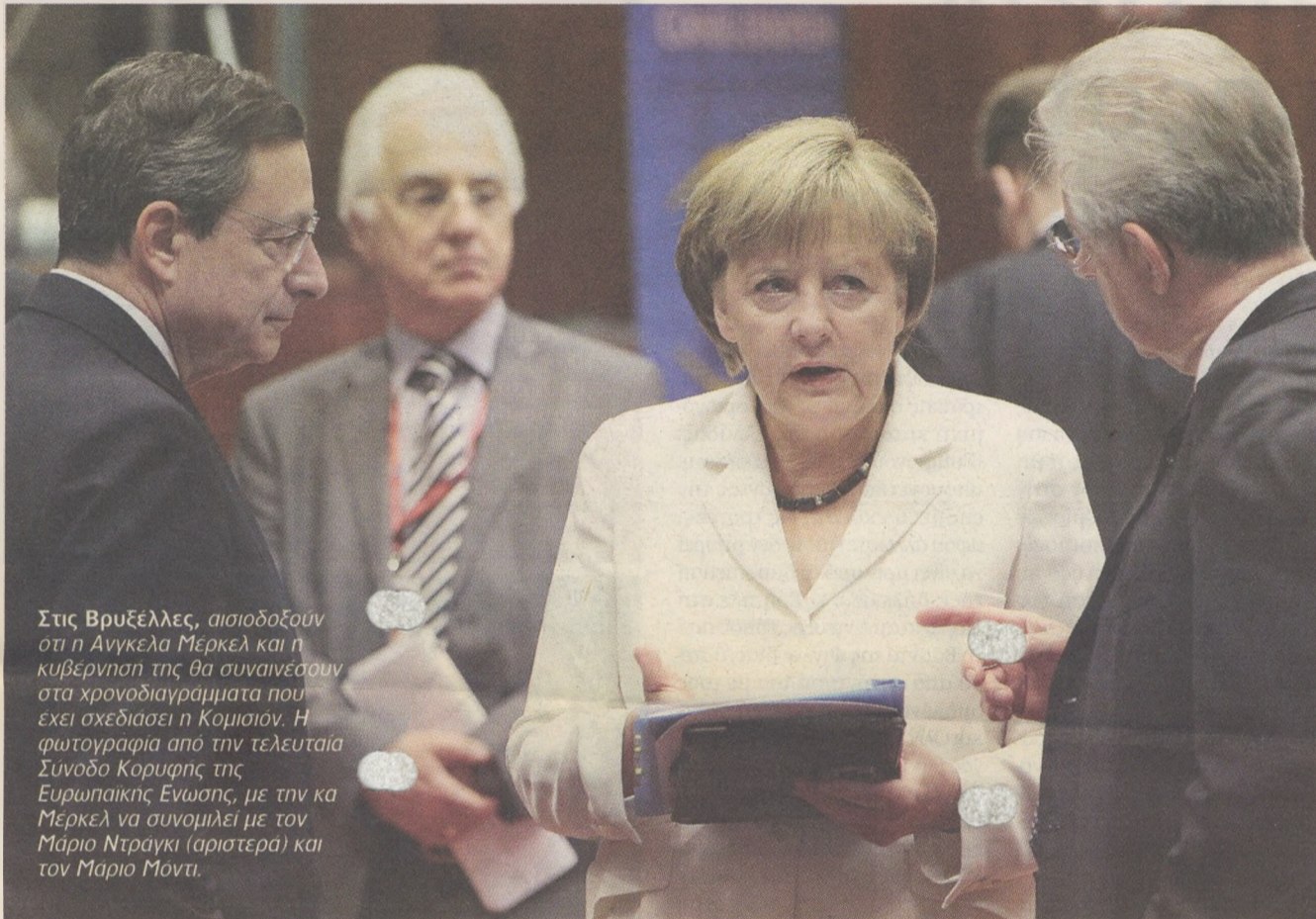
Στις Βρυξέλλες, αισιοδοξούν ότι η Άνγκελα Μέρκελ και η κυβέρνηση της θα συναινέσουν στα χρονοδιαγράμματα που έχει σχεδιάσει η Κομισιόν. Η φωτογραφία από την τελευταία Σύνοδο Κορυφής της Ευρωπαϊκής Ένωσης, με την κα Μέρκελ να συνομιλεί με τον Μάριο Ντράγκι (αριστερά) και τον Μάριο Μόντι.

Αντίθετα η Ισπανία, όπως τονίζουν, δεν είναι ακόμη βέβαιο ότι θα υποβάλει αίτημα για μιλύρες πρόγραμμα και μνημόνιο, δεδομένου ότι η Μαδρίτη μετράει τα υπέρ και τα κατά ενός τέτοιου αιτήματος και, κυρίως, θέλει να διασφαλίσει πως δεν θα συνεπάγεται τη λήψη πρόσθετων μέτρων, κάτι που σήμερα δεν το εγγυάται κανένας. Η