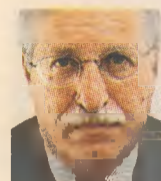
ΤΟΥ Π.Κ. ΙΩΑΚΕΙΜΙΔΗ

Κ αθώς η ελληνική κοινωνία βρίσκεται αντιμέτωπη με ακόμη ένα νέο οδυνηρό πακέτο περικοπών (κυρίως) και φορολογικών επιβαρύνσεων ύψους 13,5 δισ. ευρώ, που θα πιάξει πρωτίστως μισθωτούς και συνταξιούχους, αρκετοί, ανάμεσά τους και άτομα που μέχρι πρόσφατα