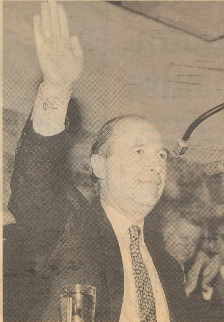
El nuevo primer ministro griego poco después de vencer en la votación interna del partido.

Una nueva dimisión, en 1995, después de dos años al frente del Ministerio de Industria y Comercio, puso de relieve una vez más las diferencias que le separaban