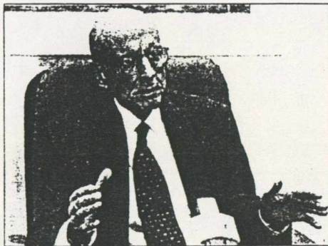
Un miembro del gobernante partido Pasok, saluda al nuevo Primer Ministro griego, Costas Simitis, luego de su espectacular triunfo. Simitis reemplazara al ex Primer Ministro, Andreas Papandreu (abajo), quien renunció a su cargo el lunes pasado.

nómica durante el primer gobierno de Papandreu en la década pasada. Pero aunque cuenta con el apoyo declarado del empresariado heleno por sus visiones moderadas y su declarado empeño por alcanzar las metas económicas que la Unión Europea impone, el nuevo Primer Ministro tendrá que demostrar que su estilo de tecnócrata político puede igualarse al ya