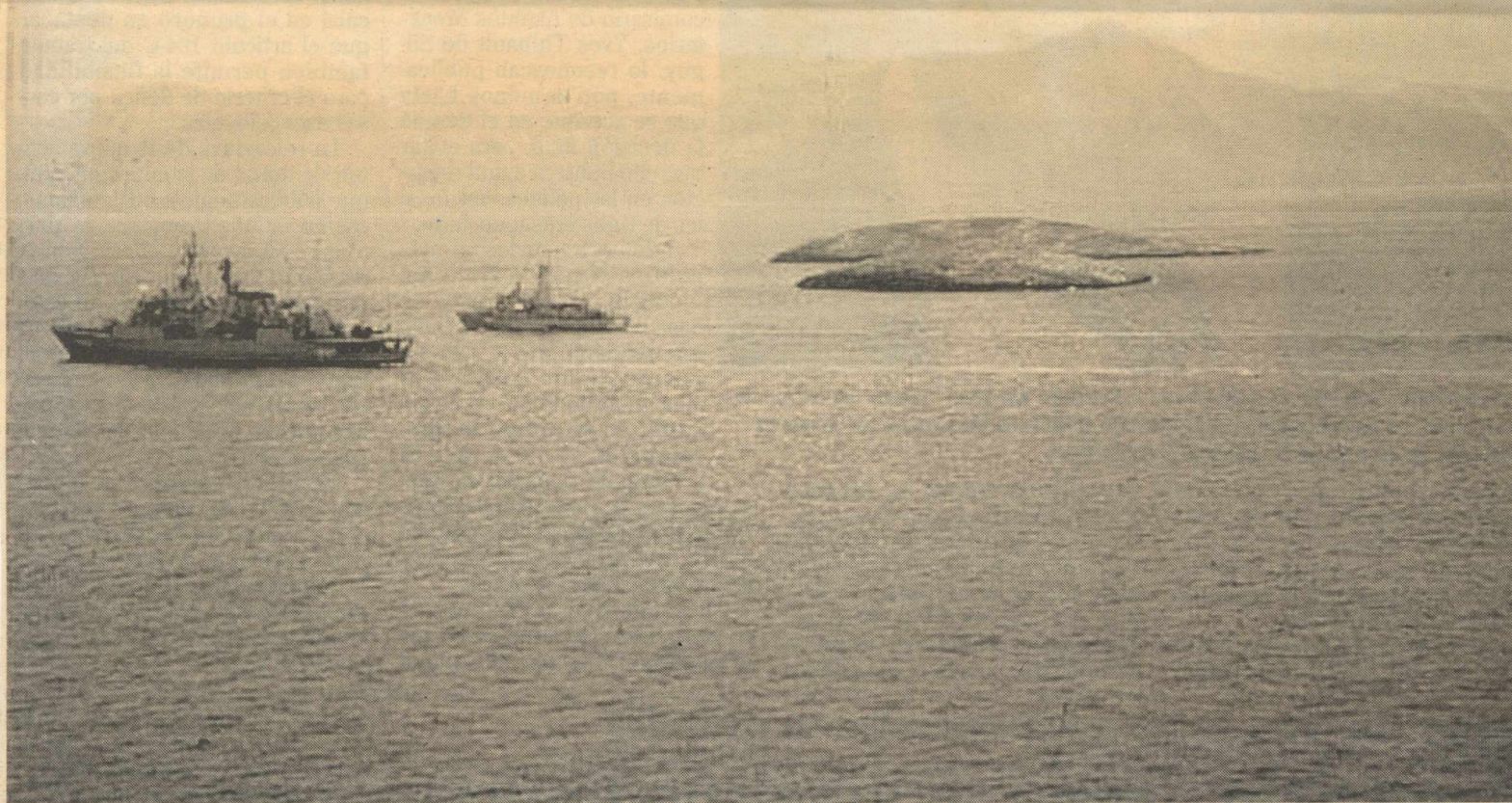
Dos embarcaciones turcas navegan en las cercanías del disputado islote de Imia en el mar Egeo.

Simitis presentó en la noche del lunes ante el Parlamento el programa del nuevo gobierno socialista, que será debatido por los 300 diputados de la Cámara —en la que el Pasok cuenta con 170 escaños— hasta hoy, cuando será sometido a votación.