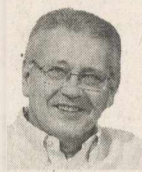
Του Δ. ΚΩΝΣΤΑΝΤΑΡΑ

Μ ε φράσεις όπως «Δεν απολογούμαι για το χθες» και «Να τελιώνουμε με τη διαφορά όπου κι αν βρίσκεται», ο Αντώνης Σαμαράς και ο Γιώργος Παπανδρέου χάραξαν με ευκρίνεια τις πολιτικές γραμμές πάνω στις οποίες θα βαδίσουν ως πολιτικοί ηγέτες στο άμεσο μέλλον.