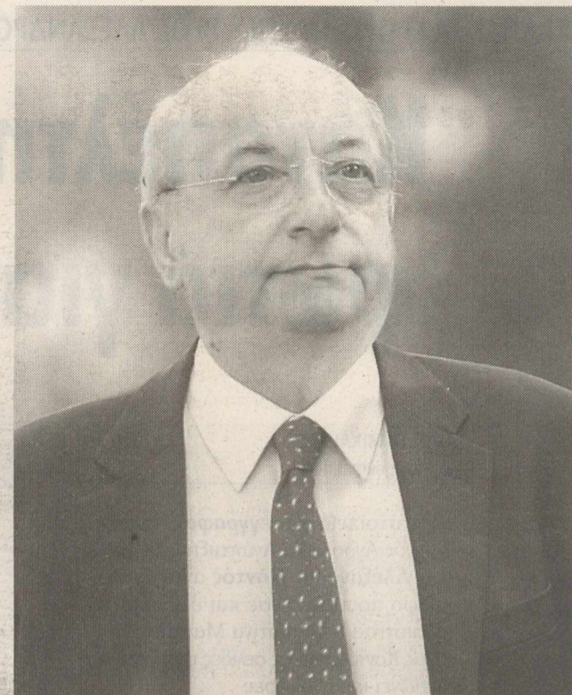
Σύμφωνα με το νόμο, εάν αποδειχθεί ότι οι κύριοι Μαντέλης και Τσουκάτος έχουν αποκρύψει ποσά έως 300.000 αντιμετώπιζουν ποινή φυλάκισης 2 ετών, ενώ για μεγαλύτερα ποσά προβλέπεται κάθειρξη τουλάχιστον 10 ετών και δήμευση των περιουσιακών τους στοιχείων.