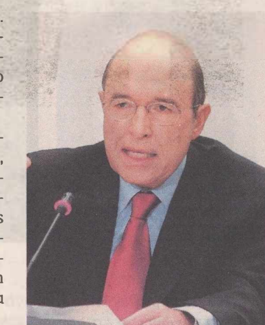
Ο Κ. ΣΗΜΙΤΗΣ απάντησε στη ΝΔ λέγοντας ότι δεν έχει να προσφέρει κάτι στις εργασίες της επιτροπής

Από την πλευρά του, το Μέγαρο Μαξίμου δήλωσε πως την απόφαση θα πάρουν τα μέλη της εξεταστικής, παραδέχεται, όμως, ότι η κατεύθυνση είναι αρνητική ως προς την κλίση του πρώην πρωθυπουργού.