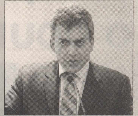
Πήραμε δάνειο και πουλήσαμε δύο σπίτια απαντά ο βουλευτής της Ν.Δ.

Όσο για την εμπορική της αξία; Πάντα με βάση εκτιμήσεις καλά ενημερωμένων