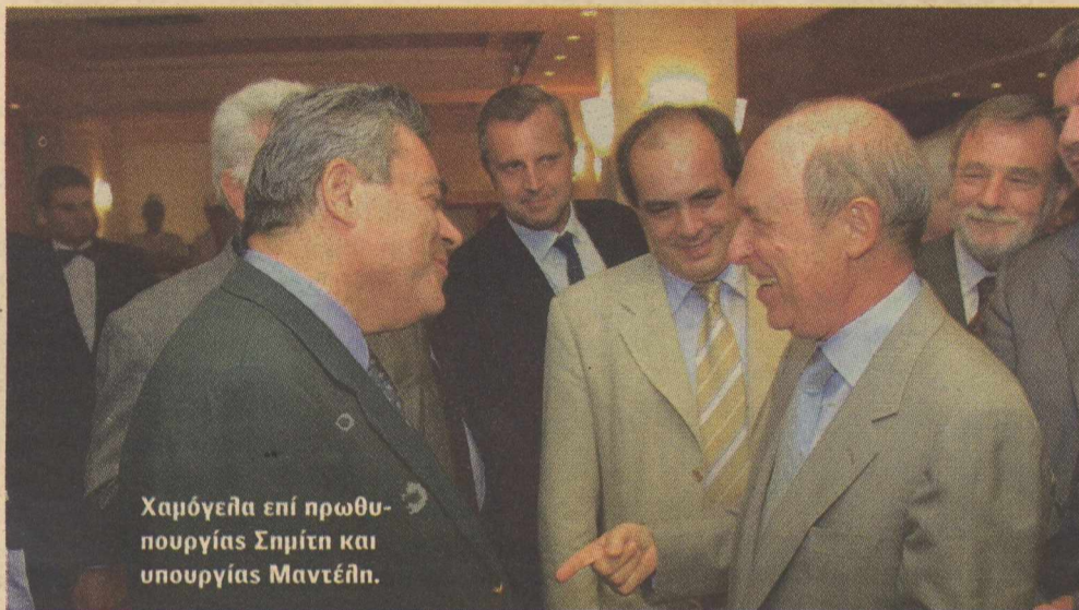
Χαμόγελα επί πρωθυπουργίας Σημίτη και υπουργίας Μαντέλη.

Στο Μέγαρο Μαξίμου, πάντως, είναι δηκτικοί για την ανακοίνωση του Κώστα Σημίτη και την αποστασιοποίηση με την οποία προσεγγίζει το θέμα. Η φράση «θλίβομαι και εξοργίζομαι επειδή τέτοιες πράξεις εκκολάφθηκαν και κατά τη διάρκεια της κυβερνητικής θητείας του ΠΑΣΟΚ 1996-2004» προκάλεσε σκληρά σχόλια: «Αυτή η έκφραση θα μπορούσε να ανήκει σε οποιονδήποτε "θλιβεται" για τα όσα έγιναν. Δεν ήταν ο οποιοσδήποτε τότε πρωθυπουργός. Ήταν ο ίδιος. Δικός του συνεργάτης ήταν ο Μαντέλης. Δικός του συνεργάτης ήταν και ο Γσου...». Θα μπορούσε να πει... που ο Τάσος Μα... δώσε την εμπι-