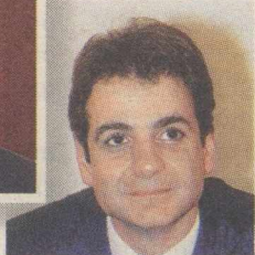
Κ. ΜΗΤΣΟΤΑΚΗΣ Η κορυφή...