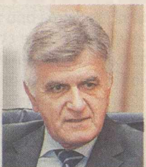
Φ. ΠΕΤΣΑΛΝΙΚΟΣ Διαφάνεια παντού;