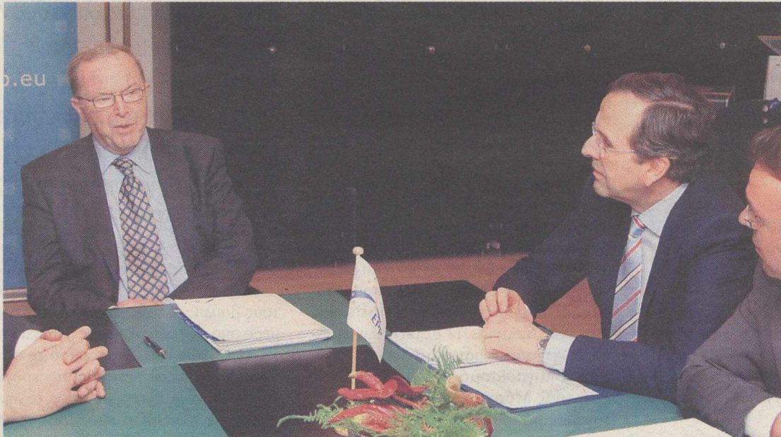
Φωτογραφία από τη συνάντηση του προέδρου της Ν.Δ. Α. Σαμαρά με τον πρόεδρο του ΕΛΚ Βίλφρεντ Μάρτενς.

Ο αρχηγός της αξιωματικής αντιπολίτευσης μετέβη χθες στις Βρυξέλλες, προκειμένου να δώσει το «παρών» στο δείπνο εργασίας του ΕΛΚ εν όψει της σημερινής συνόδου κορυφής των χωρών-μελών της Ευρωπαϊκής Ένωσης, στο περιθώριο του οποίου είχε την ευκαιρία να καταθέσει τις από-