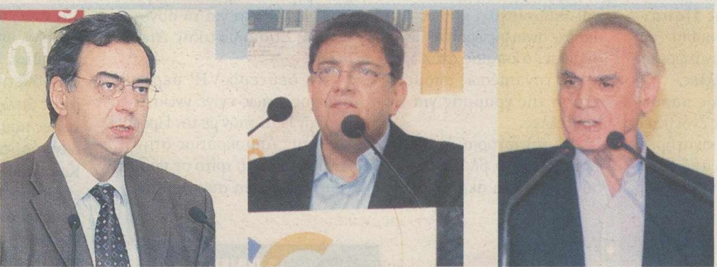
Με δύο επιστολές τον Ιανουάριο και το Μάρτιο του 2002 οι τότε υπουργοί Ν. Χριστοδουλάκης, Χρ. Βερελής και Α. Τσοχατζόπουλος ζήτησαν από τον ΟΣΕ και τον ΗΣΑΠ να αναδιρθρώσουν τις προγραμματικές συμφωνίες.

να κηρυχθεί έκπτωτη η ισπανική Demoina από προγραμματική σύμβαση για τροχαίο υλικό. Αυτό δεν συνέβη όμως ποτέ, γιατί η θέση του κύριου μέτοχου, που ήταν το υπουργείο Οικονομίας και Οικονομικών, είχε ως θέση του ότι ο ΟΣΕ «πρέπει να τα βρει με τις ανάδοχες κοινοπραξίες».