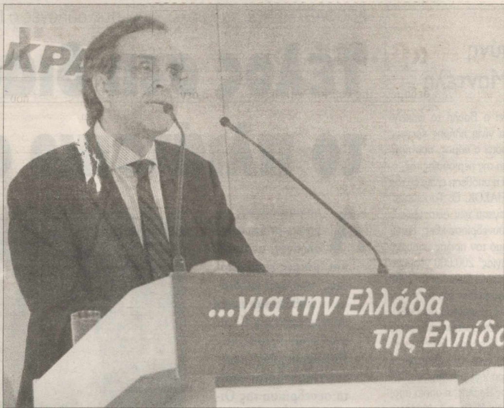
Προσφορά στη συναίνεση;

ΟΛΩΣ τι καίως αντικατάστης του κου Καστανίδη ανέλαβε ο κος Μαντέλης ο οποίος μέσα σε τρεις μήνες υπέγραψε τη σύμβαση για τις ψηφιακές παροχές του ΟΤΕ, με τη Siemens. Η υπογραφή, μάλιστα "έπεσε" στο όριο, πέρασε του οποίου θα ήταν υποχρεωμένη η κυβέρνηση να προχωρήσει σε διεθνή μειοδοτικό διαγωνισμό! Λίγους μήνες μετά σύμφωνα με την ομολογία του κου Μαντέλη, έγινε η "χορηγία". Λοιπόν, επιμένουν οι υποστηρικτές του πρώην Πρωθυπουργού ότι είναι αμέτοχος στην υπόθεση;