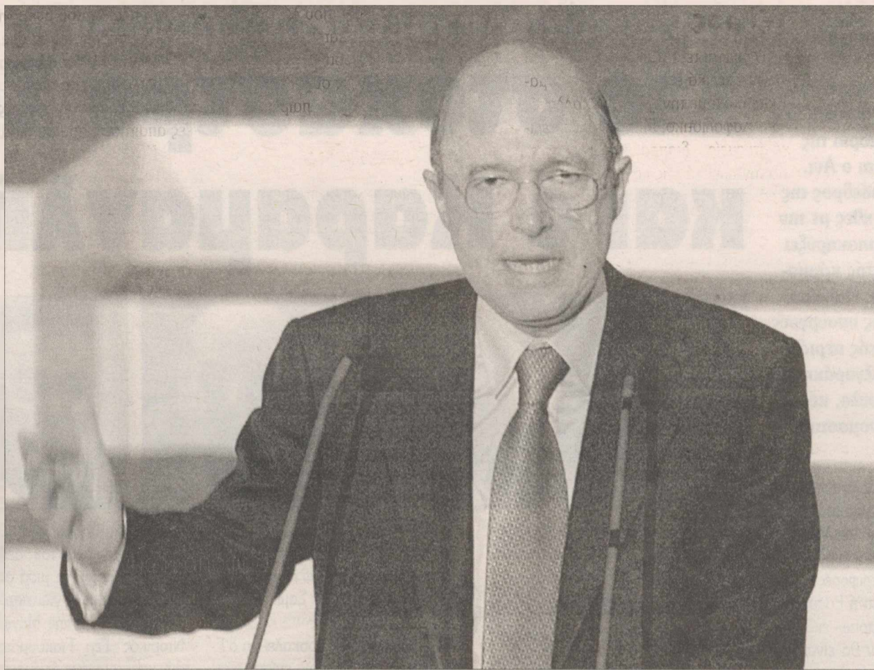
Ο κλοιός για τον πρώην πρωθυπουργό σφίγγει ακόμα περισσότερο με δεδομένη πλέον την αποστασιοποίηση του Μαξίμου και την ξεκάθαρη άρνηση του κυβερνητικού εκπροσώπου να του παράσχει έστω και ηθική κάλυψη

Επιπλέον, η επαλήθευση νέων δρακόντειων νομοθετικών σχεδιασμών κατά της διαφθοράς πολιτικών προσώπων (βάσει προτάσεων που αφορούν σε δήμευση περιουσιών, χρηματικά πρόστιμα, αλλά και σε φυλακίσεις πολιτικών που αποδεδειγμένα με τις πράξεις και τις παραλείψεις τους προκάλεσαν ζημιά στο Δημόσιο αλλά και εισπλήξεις για αναζήτηση όχι μόνο ποινικών ή πολιτικών αλλά και αστικών ευθυνών, που θα σημάνευε δικαστική διεκδίκηση αποζημιώσεων από