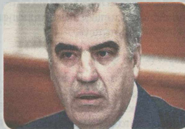
ΔΗΜΗΤΡΗΣ ΡΕΠΑΣ Υπουργός Υποδομών

«Το ΠΑΣΟΚ αντέχει. Μη βλέπετε τα μικρά, αλλά τα μεγάλα».