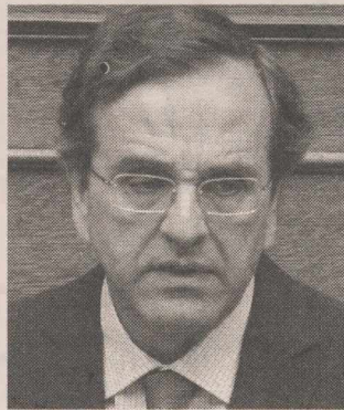
Α. Σαμαράς: Να θωρακιστεί η δημόσια ζωή από τη δραστηριότητα επίορκων πολιτικών

Ενδεικτική των προθέσεων η δήλωση του προέδρου της Επιτροπής Οικονομικού Ελέγχου της Βουλής, Β. Αργύρη (ΠΑΣΟΚ), ο οποίος υπέδειξε τον τρόπο τιμωρίας του πρώην υπουργού, υπενθυμίζοντας πως εκ του νόμου προβλέπεται, στην περίπτωση απόκρυψης φορολογικών στοιχείων στο «πόθεν έσχες», ποινή φυλάκισης τουλάχιστον 2 ετών που φτάνουν στα 10 χρόνια κάθειρξης εάν το ποσό υπερβαίνει τα 300.000 ευρώ.