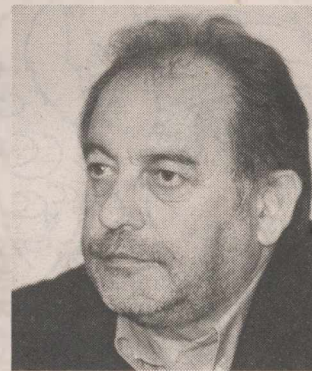
Β. Αργύρης: Η απόκρυψη στοιχείων από το «πόθεν έσχες» τιμωρείται με φυλάκιση

Ο Α. Σαμαράς ζήτησε από την κυβέρνηση τη θεσμική θωράκιση της δημόσιας ζωής από τη δραστηριότητα επίορκων πολιτικών, χαρακτηρίζοντας την περίπτωση Μαντέλη ως το πλέον αρνητικό ορόσημο στις σχέσεις του πολιτικού κόσμου με τη διαφάνεια και την αξιοπρέπεια. «Το να εκτονώσεις το λαϊκό αίσθημα είναι πάντοτε πιο εύκολο από το να ρίξεις παντού φως» είπε χαρακτηριστικά.