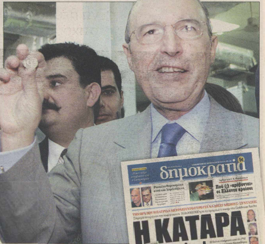
Ο Κώστας Σημίτης κατά την παρουσίαση του εννύ. Δεξιά: Το προποσέλιδο της «δημοκρατίας» στις 20 Μαρτίου 2015

Το πρώτο τέτοιο ομόλογο, ύψους 435.000.000 ευρώ, είχε λήξει στις 15 Μαΐου 2012, εν μέσω των δύο εκλογικών αναμετρήσεων εκείνης της χρονιάς. Η πρόταση πληρωμής προς το κερδοσκοπικό Darts Fund είχε γίνει από τον (απερχόμενο) κ. Παπαδήμο, με τον οποίο συμφώνησαν στις 9 Μαΐου οι πολιτικοί αρχηγοί, σε σύσκεψη υπό τον Κάρλο Παπούλια, αν και ο πρόεδρος του ΠΑΣΟΚ Ευ. Βενιζέλος