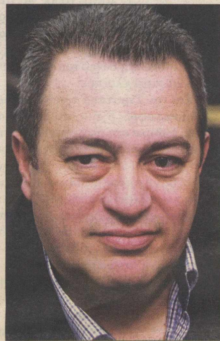
Συνομιλία του Αντώνη Σαμαρά με τον Χρυσάνθο Λαζαρίδη. Δεξιά: Η Μαριέττα Γιαννάκου και ο Ευριπίδης Στυλιανίδης

τον Κώστα Τζαβάρα. Ολοι τους, μετά τις εκλογές, κρατούν διακριτές αποστάσεις από την ηγεσία και οι τρεις πρώτοι ανοικτά «πυροβολούν» τον Αντώνη Σαμαρά.