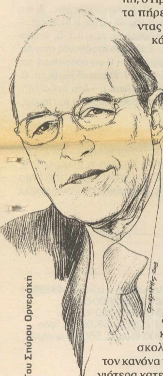
Του Σπύρου Ορνερράκη

Band on the run Η οικογένεια Πολ Μακάρτνεϊ, και με το νέο σχήμα της, συνεχίζει να είναι ροκ και «φευγάτη». Απόδειξη, η εγκυμονούσα σύζυγος του «σκαθαριού», η Χέδερ Μιλς της οποίας η σύντομη καριέρα στο μόντελιγκ διακόπηκε βίαια προ ετών λόγω ατυχήματος. Ακρωτηριασμένη από το ένα πόδι, πλην μαχήτρια της ζωής, η Χέδερ στρατεύτηκε στον αγώνα της επιτροπής του ΟΗΕ κατά των ναρκοθετήσεων. Εδώ τη βλέπουμε να δείχνει στον γνωστό παρουσιαστή του CNN Λάρι Κινγκ τη διαφορά ανάμεσα σε δύο ψεύτικα πόδια. Το ένα made in England και το άλλο made in USA.