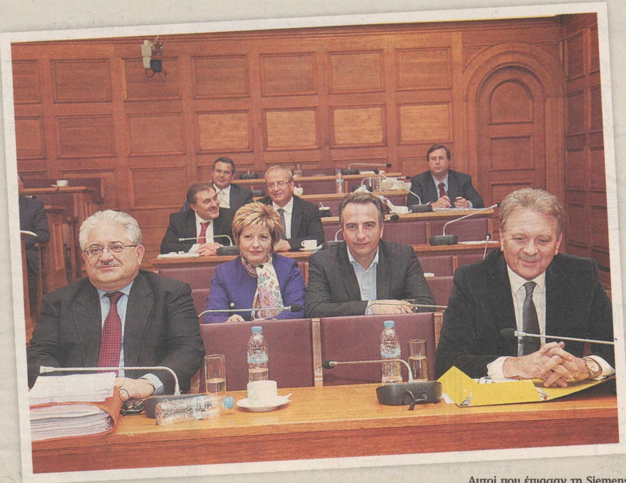
Αυτοί που έπιασαν τη Siemens